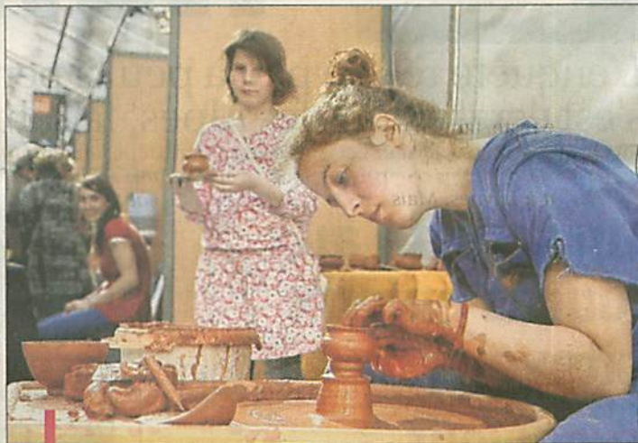
Romance, 10 ans, a fait sa première poterie, sous les conseils de Lucile, 24 ans, passionnée et appliquée.